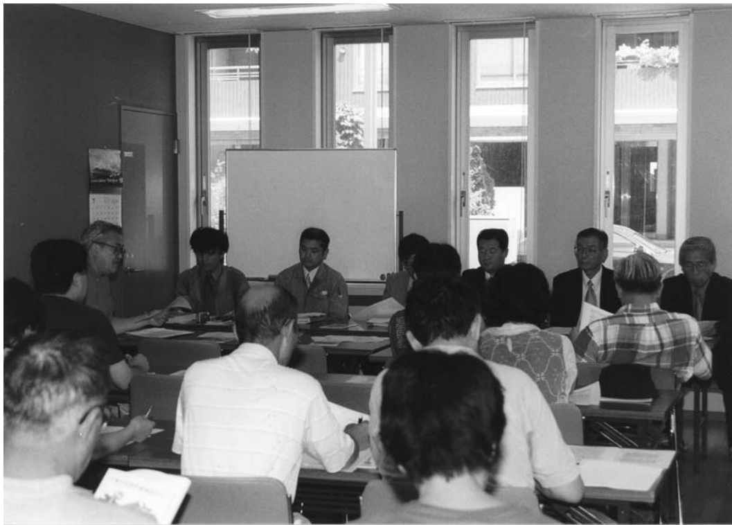
住民と行政が行った「第一回公民館を語る会」（2001年7月14日）。ベイタウンにふさわしい公民館の姿を模索して、この会はそのご何度も行われた。

昨年まで住んでいたベイタウンでの5年間は特別でした。当初は整然とした街並み以外に何も無い？と思っていましたが、音楽を通じた地域の人々との出会